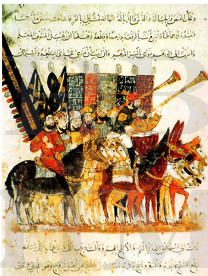
Illuminura das “Estações de Hariri” (1237). 31

Por volta da meia-noite, o exército muçulmano se preparou para a batalha e atacou o acampamento cristão nas primeiras horas da manhã do dia seguinte. A imprevista presença dos mouros “produziu simultaneamente estupor e temor nos inimigos”, que saíram das tendas desordenadamente: