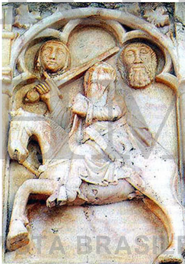
Escudo de armas da cidade de Évora 1 (Portugal, século XIV).