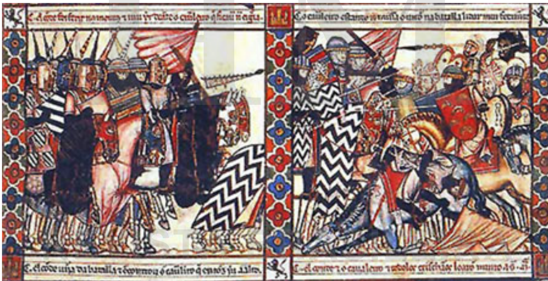
Batalha de Las Navas de Tolosa. 57