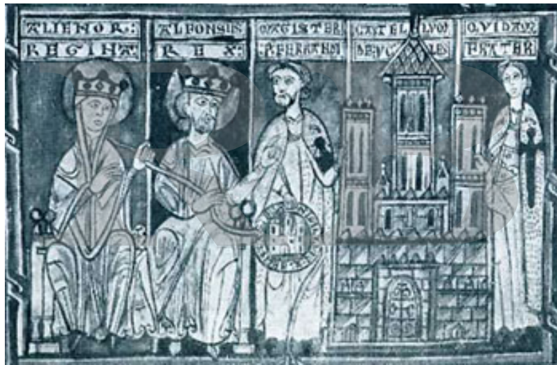
Afonso VIII e a rainha Eleonor concedendo a cidade e a vila de Uclés ao mestre da Ordem de Santiago 20

"ençarrado" com ela durante sete meses; "E dizem alguns que este tão grande amor que ele tinha por esta judia não era senão por feitiços que ela sabia fazer" 19 .