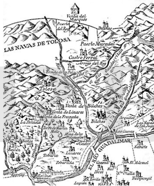
Las Navas de Tolosa de acordo com um mapa do século XVI. 53

Com o retorno dos barões, os reis ordenaram que armassem suas tendas em frente aos mouros. Dessa vez impaciente, Miramolim armou sua tenda à direita da do rei de Castela, colocando suas azes cheias de mouros, acaudilhadas por “muitos reis e altos homens” 54 . No entanto, dessa vez os cristãos não tiveram pressa: percebendo o “ardil dos mouros” e vendo que seus cavalos estavam fatigados por terem atravessado o estreito, decidiram descansar, deixando o rei almôada esperando em campo de batalha. Enquanto isso, o arcebispo de Toledo, D. Rodrigo, aquele que fora ao papa solicitar o chamamento de cruzada para essa batalha, pregava. Pedia a todos que comungassem, concedendo o perdão divino aos que entrassem na batalha com o coração puro. Era um domingo. No dia seguinte, após a missa matinal, quando os prelados deram o Santo Sacramento aos guerreiros, a cavalaria pôs-se em marcha, com o sol irradiando sua luz 55 .