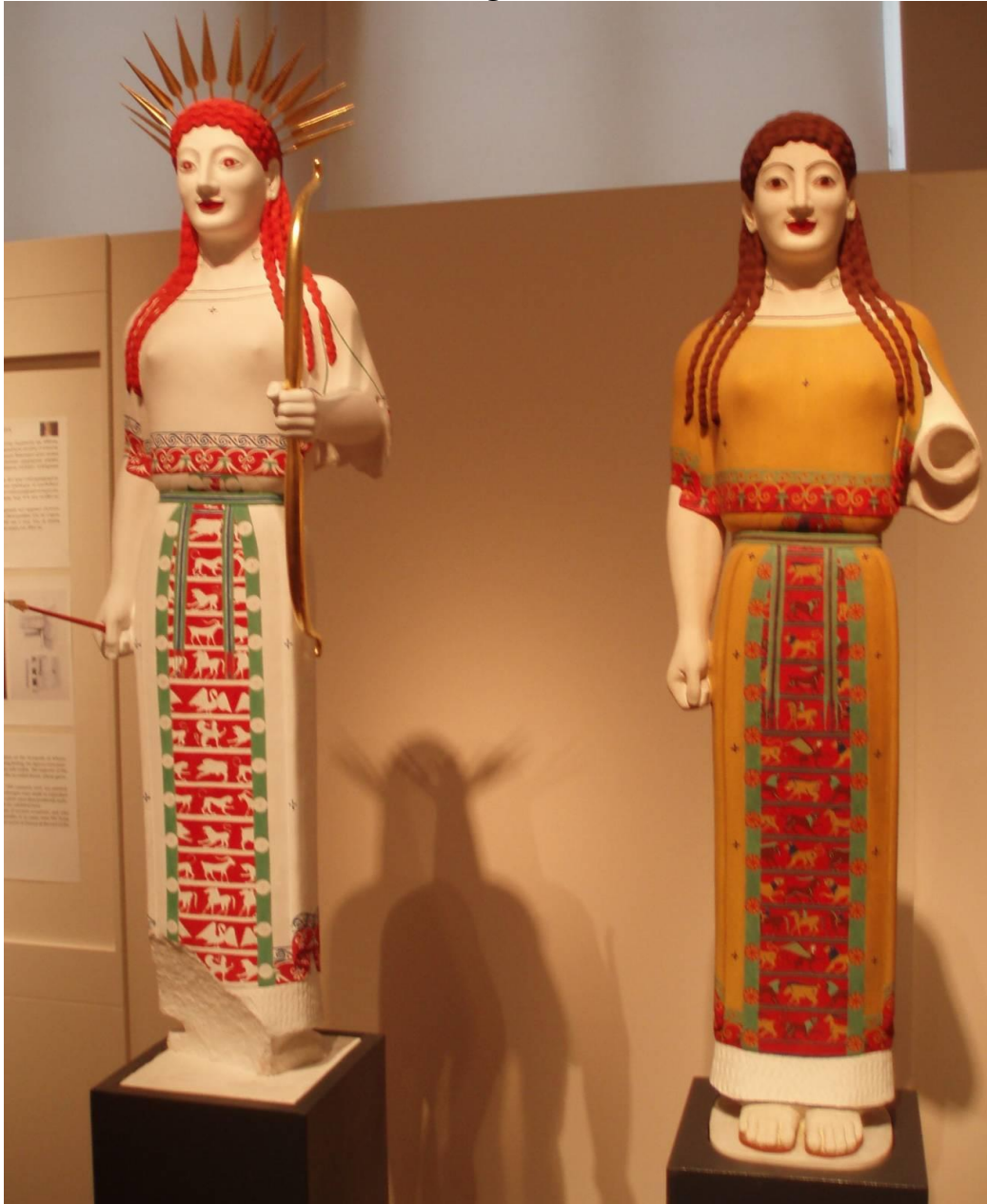
À esquerda, Ártemis, à direita, Atena. Exposição Bunte Götter – Die Farbigkeit antiker Skulptur ( Deuses coloridos – as cores da escultura antiga ), na Gliptoteca de Munique, em 2003.

De certo modo, a reconstrução total da apreciação estética antiga e medieval também traz à tona o caráter popular de sua tradição cromática, desejosa de maravilhar, de estupefar, de se igualar à beleza, ao colorido natural. 35