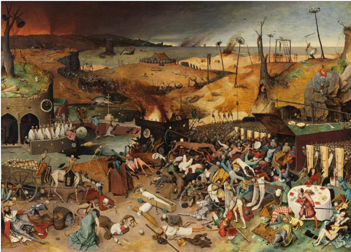
IMAGEM 1 - O TRIUNFO DA MORTE (C. 1562) DE BRUEGEL, O VELHO (1525-1569). ÓLEO SOBRE MADEIRA, 117 X 162 CM, MUSEO DEL PRADO, SALA 025.

Multiplicastes vossos mortos nesta cidade e enchestes vossas ruas de mortos. Ez 11, 6.